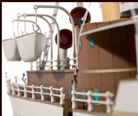
An den per Hand eingesetzten Davits hängen die insgesamt vier Rettungsboote.