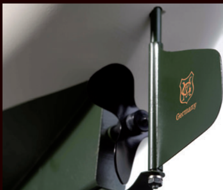
Die Schiffsschraube wird von einem kräftigen Uhrwerksmotor angetrieben.