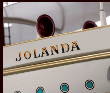
Die liebevoll angebrachte Beschriftung komplettiert das Modell.