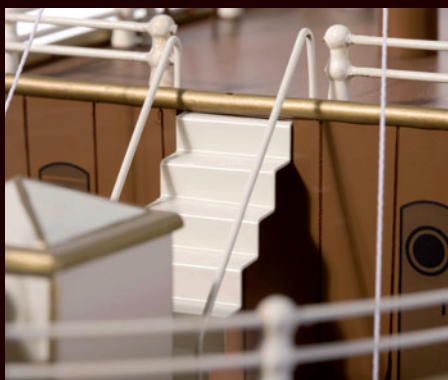
Eine Treppe mit fein nachgebildeter Reling führt zu den Rettungsbooten.