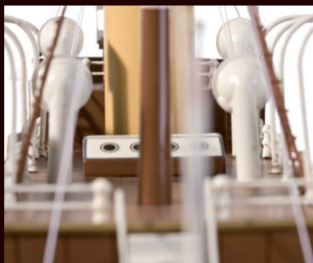
Blick vom Heck auf das Bootsdeck und den mächtigen Kamin.