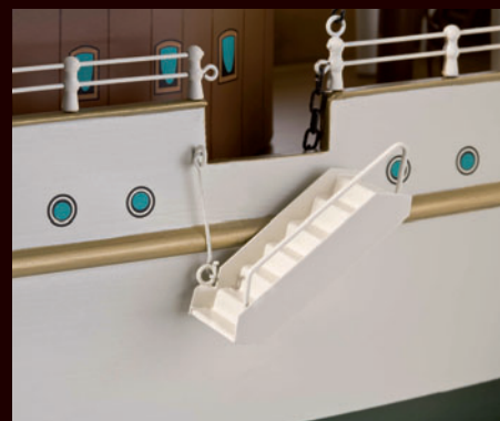
Seitlicher Blick auf die feine Lackierung, die Bullaugen und die bewegliche Aufstiegstreppe.